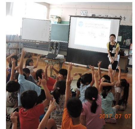
「ミルク教室」では、牛乳のことをたくさん教わりました。バター作りもしました。