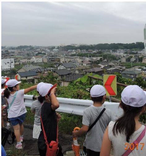
町探検に出かけました。富士見小学校の北側・南側に探検に出かけました。2学期には、グループに分れて探検に出かけます。住んでいる方角とは違うところに行くと新しい発見も多くあったようです。