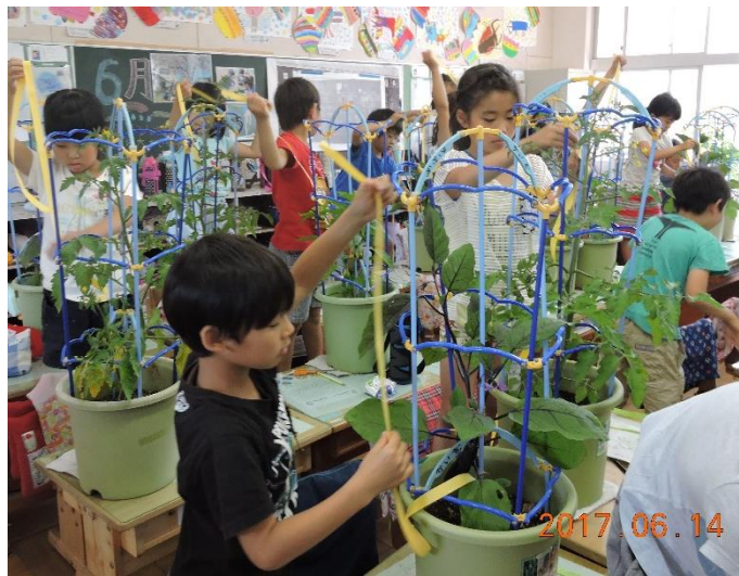
野菜を育てました。ミニトマト、ナス、ピーマンが収穫できました！！